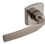
Béquille sur rosace