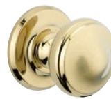
POMMEAU Laiton poli